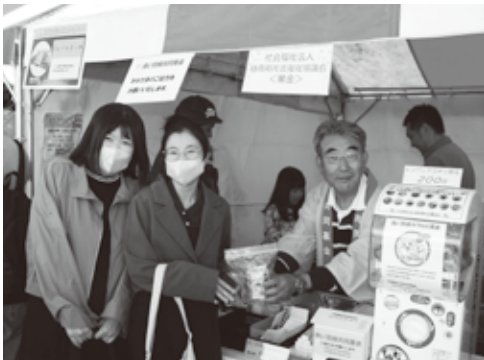
▲ 街頭募金のようす(ぎなんフェスタ会場)