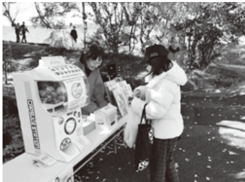
▲ 街頭募金のようす(笠松けいば)

ぎなんフェスタ会場 ……10月20日(日) 岐阜地方競馬組合 笠松けいば ……11月19日(火) 12月12日(木) おんさい広場はぐり ……12月 4日(水) DCMカーマ21岐南店 ……11月26日(火)