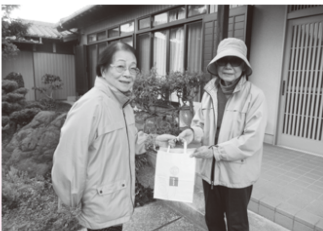
▲ 運動サロンひまわりの方