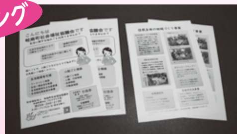
▲ ポスティングちらし

地域の方に気軽に相談していただけるように、社会福祉協議会活動の情報を、ポスティングしてお届けしました。