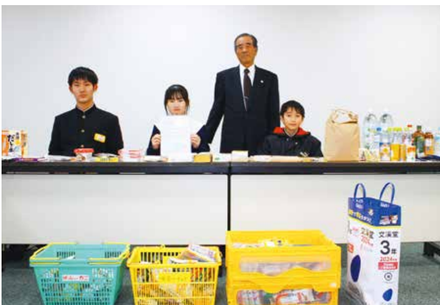
▲ 岐南中学校3年生 平和学習「貧困」対策チーム代表の皆さん