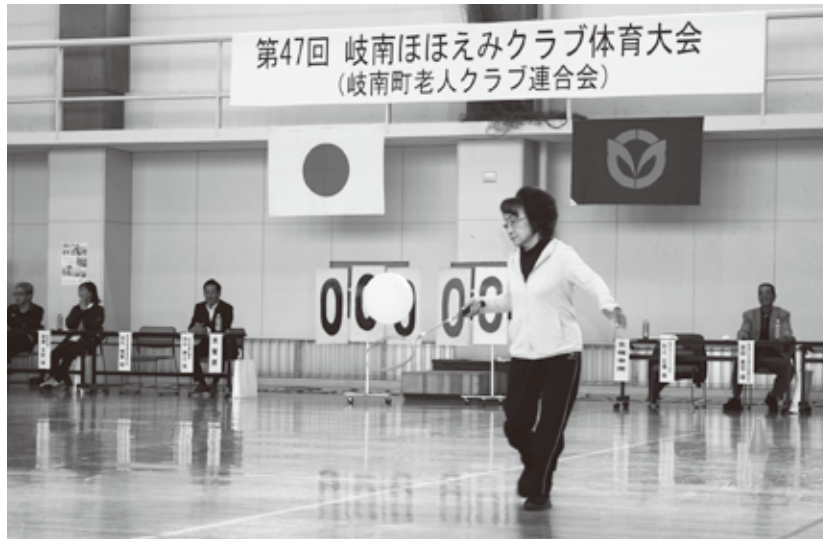
▲ 競技のようす(ラケットリレー)

また、木の棒をピンに向かって投げ、倒れたピンの広がりやその数で点数を競う、新たな軽スポーツ「モルック」を体験しました。