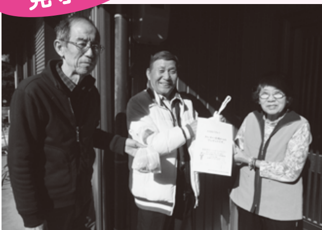
▲ わいわい広場の皆さん

この他、社会福祉協議会の相談窓口や活動を広く周知し、つながりや支援のきっかけづくりを目的に、福祉サービスの情報をお届けするポスティング事業を実施しました。