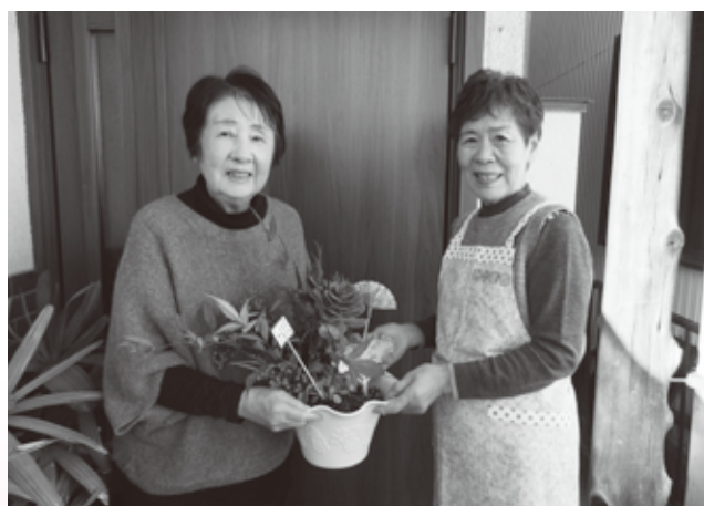
▲ みやまちサロンの方